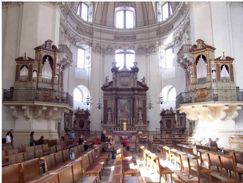
Pipe Organ in the Dom of the Salzburg, Austria.

（轉載自網頁 http://www.praiseu.com/shareserve/serve02/serve02-1.htm ）