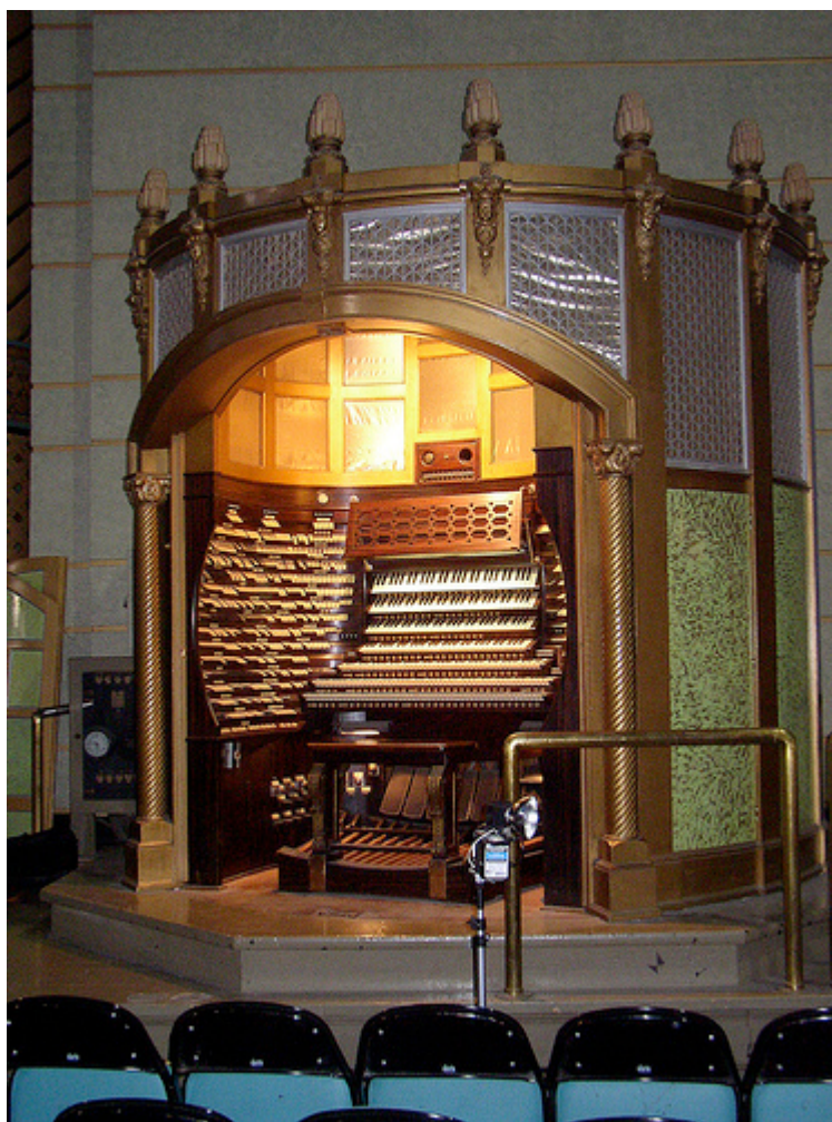
Pipe Organ in the Boardwalk Hall, Atlantic City.